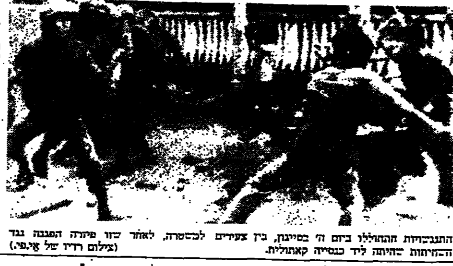
התברכות ההדדיות בין הו"מ, משה דיין, ושר החוץ הצרפתי, ז'ורז' וואלף, במסגרת ביקורו של שר החוץ הצרפתי בישראל.

נסתים ביקור שר החוץ הצרפתי כאן נפגשה בצה"ל, ביום ראשון, 2 (20.10.74), הו"מ, משה דיין, עם שר החוץ הצרפתי, ז'ורז' וואלף, במסגרת ביקורו של שר החוץ הצרפתי בישראל. הפגשה זו, שהתקיימה במסגרת הביקור הרשמי של שר החוץ הצרפתי בישראל, נערכה בחדר המועצה לביטחון לאומי, בירושלים. בהשתתפות שר החוץ הצרפתי, הו"מ, משה דיין, ונציגים פלשתינאים, נדונו שני הצדדים את נושאי הביטחון וההגנה, וכן את נושאי הכלכלה והסחר. שר החוץ הצרפתי, ז'ורז' וואלף, הביע את תמיכתו של צרפת בישראל, ואת רצונו של צרפת להמשיך ולתמוך בישראל במסגרת ארגון הסחר העולמי. הו"מ, משה דיין, תודה על תמיכת צרפת בישראל, ובייחוד על תמיכתה של צרפת בישראל במסגרת ארגון הסחר העולמי. שני הצדדים הסכימו על כך שיש להמשיך ולתמוך בישראל במסגרת ארגון הסחר העולמי, וכן על כך שיש להמשיך ולתמוך בישראל במסגרת ארגון הסחר העולמי.